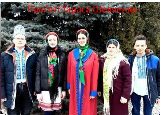
Пам'яті Тараса Шевченка